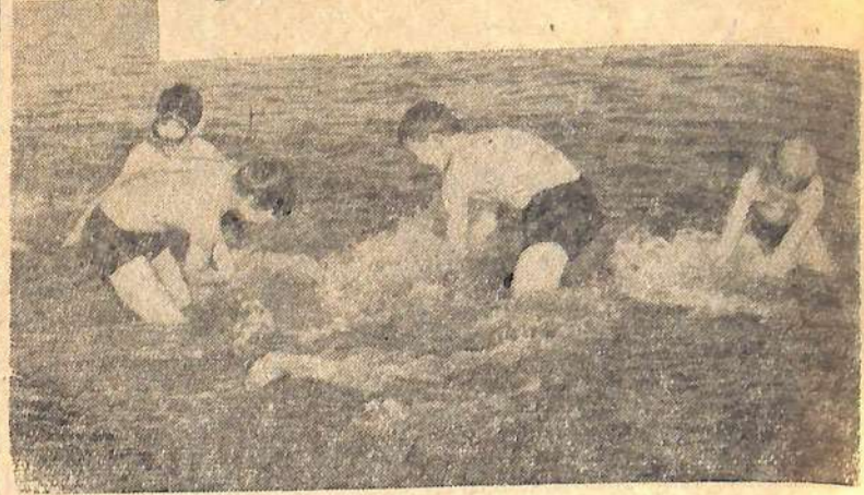
Фотоэтиюд В. Полова.