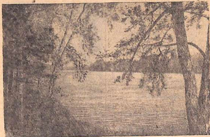
Уголок родной природы.