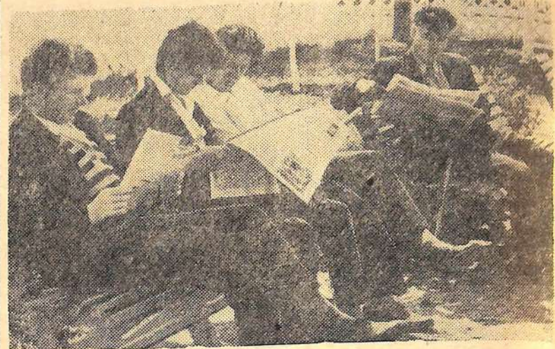
Прохлада. Тень деревьев. Чистый воздух. Приятно посидеть в садике и почитать свежую газету.