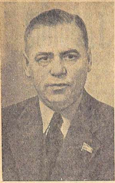
ВИЛИС ЛАЦИС — латвийский советский государственный деятель и писатель. Сегодня исполняется 60 лет со дня рождения.