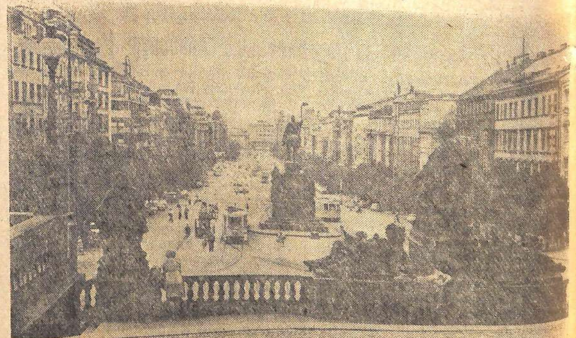
Столица Чехословацкой Социалистической Республики Прага. Вацлавская площадь.