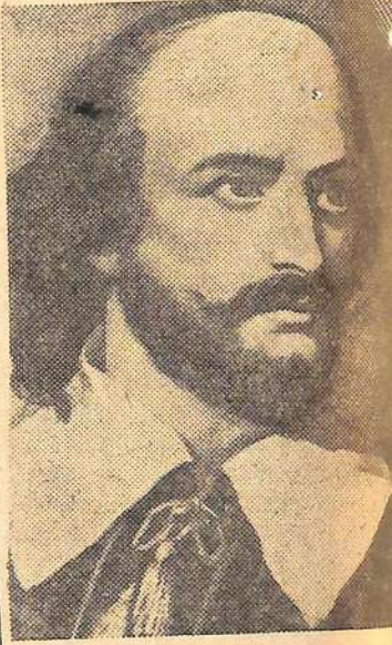
Вильям Шекспир—великий английский поэт и драматург. 23 апреля исполнилось 400 лет со дня рождения.