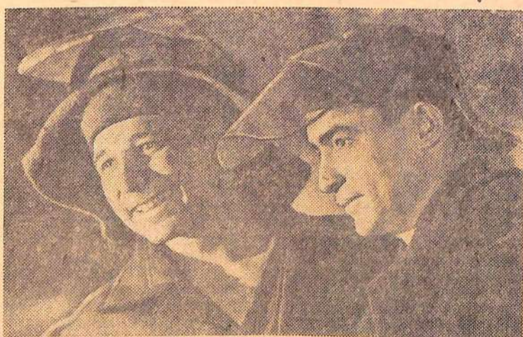
Встав на предмайскую вахту, передовые металлурги борются за сверхплановый выпуск чугуна, за высокое качество продукции.

И вот результат. Укладка бетона доведена до 600 кубометров в смену. А 22 апреля бетонщики выполнили обязательство на 8 дней раньше срока.