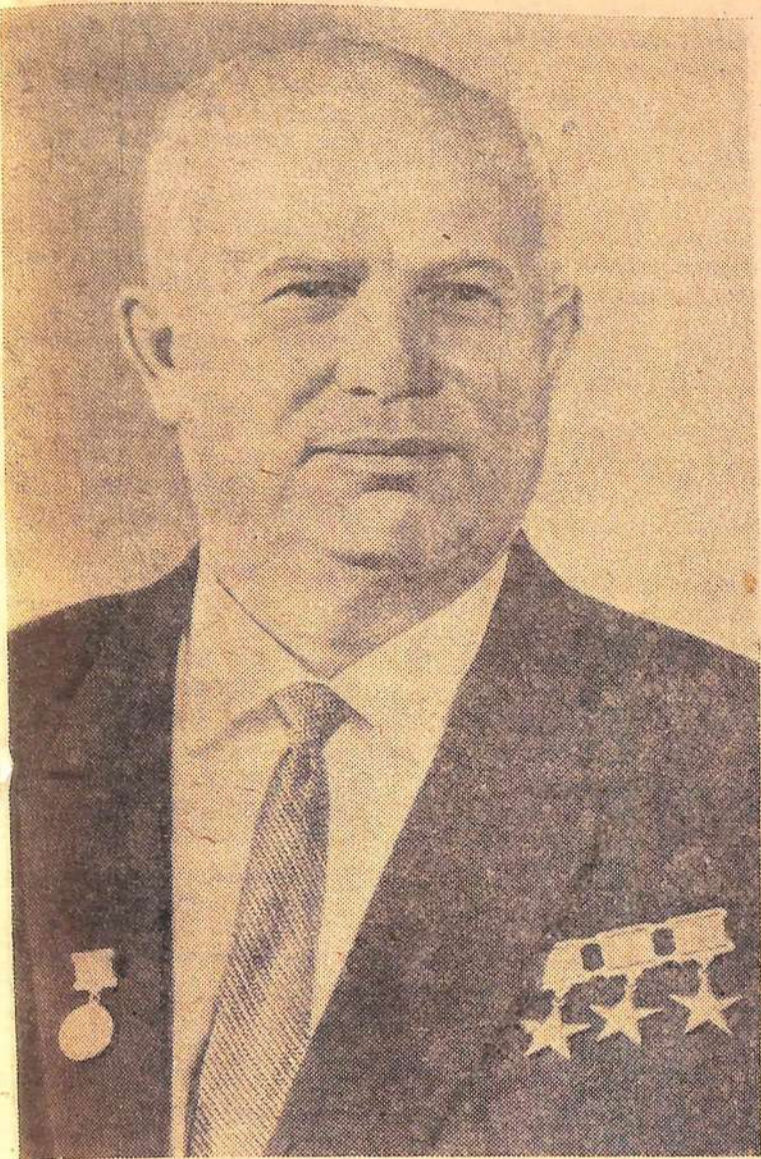
Хрущев Н. С. — Первый секретарь ЦК КПСС, Председатель Совета Министров СССР.