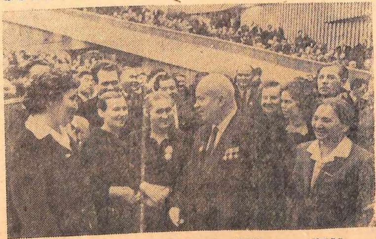
Н. С. Хрущев среди делегатов XXII съезда КПСС.