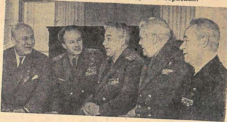
На снимке: первые герои Советского Союза летчики полярной авиации (слева направо): М. Т. Слепнев, Н. П. Каманин, А. В. Ляпидевский, М. В. Водопьянов и В. С. Молоков, принимавшие участие в спасении челюскинцев.

Челюскинская эпопея показала всему миру величие советских людей, вошла яркой страницей в летопись покорения Арктики.