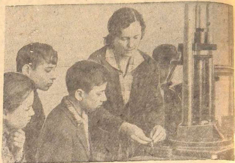
Частыми гостями судоремонтного завода являются школьники. Здесь на практике они видят применение законов физики, химии и математики.

Остается пожелать, чтобы такие дни воспитателя стали у нас традиционными.