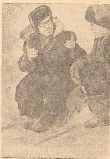
Опять ушла...