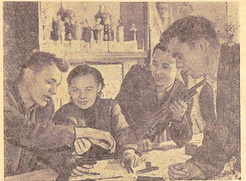
Целинный край. Зерносовхоз «Двуречный» Есильского района Целиноградской области—старейший на целине. Здесь в марте 1954 года поселились первые рабочие.

Т. АРТАМОНОВА, доярка колхоза имени XXI партс'езда.