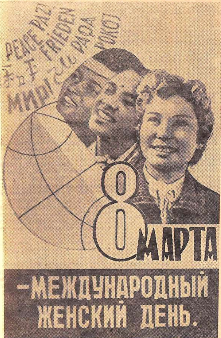
Плакат художника Б. Антонова.

№ 38 (175), Год издания 1-й, Суббота, 7 марта 1964 года | Выходит 4 раза в неделю Цена 2 коп