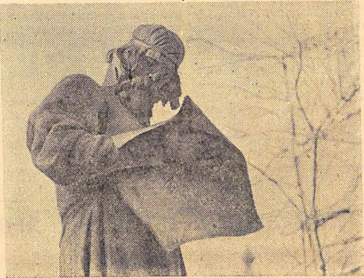
Москва. Памятник первопечатнику Ивану Федорову.