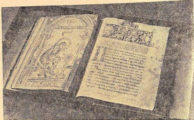
Первая русская книга, напечатанная типографским способом, «Апостол». Издана Иваном Федоровым и Петром Мстиславцем. Начало русского книгопечатания.

Последняя треть XIX века — период расцвета русского книжного дела. Выпуск книг вырос с 1773 названий в 1861 году до 5451 в 1877 году. В некоторые годы количество изданий уменьшалось в связи с усилением цензурного гнета, но в целом книжная продукция России росла.