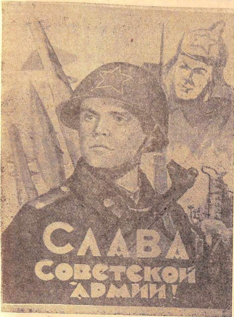
Плакат художника Б. Антонова.

№ 30 (67), Год издания 1-й | Суббота, 22 февраля 1964 года | Выходит 4 раза в неделю Цена 2 коп