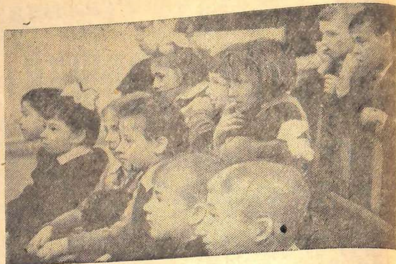
Интересно прошел вечер сказок, подготовленный учениками пятых и шестых классов школы № 38 для своих подшефных второклассников. Особенно понравилась ребятам инсценировка сказки С. Михалкова «Как медведь трубку нашел». Смотрите, с каким вниманием смотрят ребята на сцену.

Н. ИВАНОВ, начальник инспекции госпожнадзора.