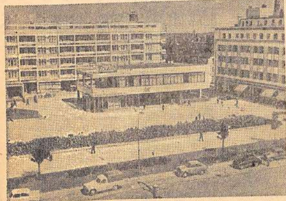
Хорошеют и благоустриваются города Польской Народной Республики. На месте пустырей вырастают современные жилые дома, магазины, кафе, кинотеатры, школы и другие культурные учреждения.