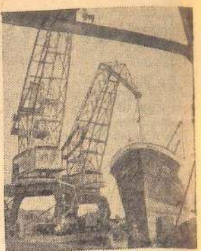
Грузинская ССР. Из года в год растет грузооборот потийского порта—морской ворот Грузии. С начала этого года потийские портовики переработали сверх плана десятитысяч тонн народнохозяйственных грузов. Все погрузочно-разгрузочные работы механизированы. На снимке: погрузка хромовой руды в порт.