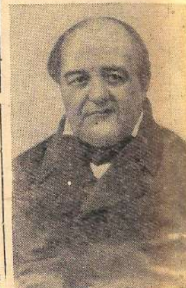
ЩЕПКИН Михаил Семенович — великий русский актер. 17 ноября исполняется 175 лет со дня его рождения.

При Сухоотрогском клубе создана секция юных кинолю-бителей. Возглавляет ее кино-механик Кулаков. Дети изуча-ют киноаппаратуру, учатся де-монстрировать фильмы, во всем помогают киномеханику. Они первые, кто рассказывает лю-дям содержание той или иной кинокартины, приглашают не-прременно посмотреть ее.