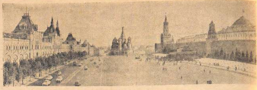
Москва, Красная площадь.