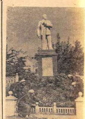
Один из живописных уголков на территории завода имени Дзержинского.