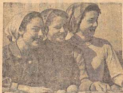
Колхозы и совхозы Астраханской области значительно перевыполнили план отгрузки помидоров в промышленные

центры страны. Высокий урожай получен в колхозе имени ВКП(б) Икрянинского производственного управления. С