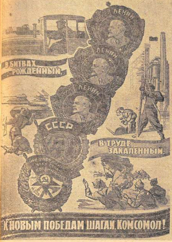
Плакат художника В. Писаревского (ИЗОГИЗ).

Орган Балаковских партийного комитета производственного колхозно-совхозного управления, горкома КПСС, районного и городского Советов депутатов трудящихся Саратовской области