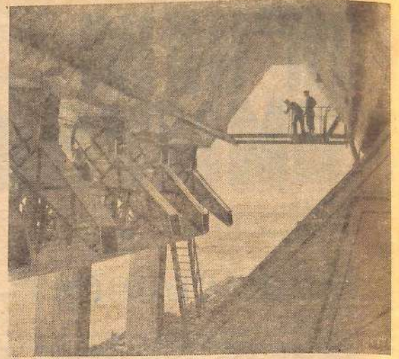
Армянская ССР. Завершено строительство дробильно-сортировочного цеха Армянского завода туфоблоков с вводом на полную мощность анод будет выпускать в год 250 тысяч кубических метров туфовых блоков и 600 тысяч кубометров щебня

С. БУРАКОВ, секретарь парторганизации горпищекмбината.