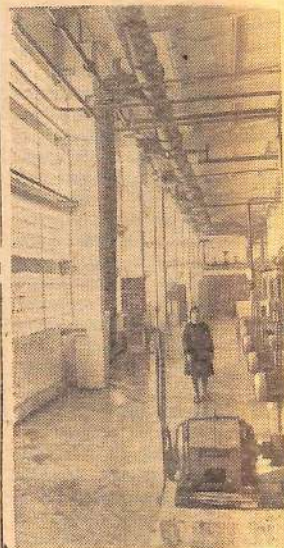
Химики Барнаульского комбината искусственного и синтетического волокна стали хозяевами новых цехов. Вступил в строй действующих химический корпус № 2, который будет вырабатывать вискозу для штапельного, целлюлозного и кордного производства. На снимке: отделение смеси-телей вискозного цеха.