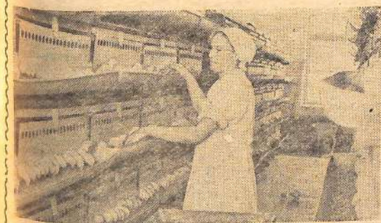
На снимке: батарейный цех. Здесь выращиваются цыплята на инкубаториях.