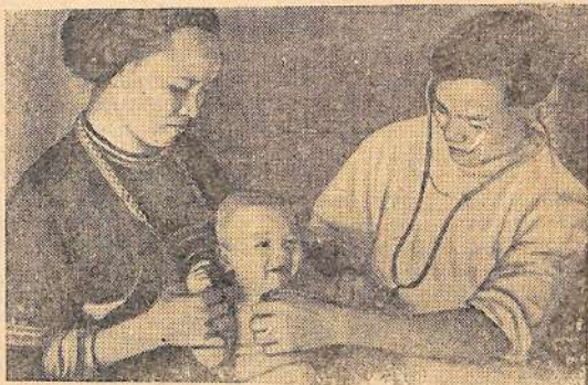
В Демократической Республике Вьетнам уделяется большое внимание организации здравоохранения. Сейчас даже в самых отдаленных районах страны созданы медицинские пункты.

Подписная цена на год — рубля 12 копеек. Подписывайтесь на газету «Огни коммунизма», читайте, пишите в свою газету!