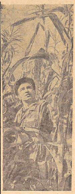
Рязанская область. Коллектив Мещерской зональной опытно-мелиоративной станции начал в этом году широкое наступление на залежные луга Прионской поймы. Распаханы 150 гектаров веками пустовавшей земли. На созданных здесь опытных участках выращены кукуруза, бобы, огурцы, картофель, сахарная свекла. Особенно хорошие урожаи дала кукуруза.

октября по 15 ноября месячник по завершению подготовки и организованному переходу на зимнее стойловое содержание скота в колхозах и совхозах. Что нужно сделать за это время? Не позднее 25 октября силами специализированных бригад завершить работы по сбору соломы, уборке кукурузы на силос и закладке комбисилоса в соответствии с заданием, а к 15 ноября подвести к местам зимовки скота не менее 70—75 процентов заготовленных грубых кормов. Одновременно надо составить планы их расходования по всем видам и применить наиболее рациональные нормы кормления скота. Хозяйство должно иметь месячные планы, а фермы и бригады—декадные. Большая работа предстоит по формированию стада с учетом породных и продуктивных качеств, расстановке скота, организации ветеринарного и зоотехнического обслуживания. Главное—подобрать на все фермы добросовестных людей, правильно расставить кадры, провести в эти дни семинары со всеми животноводами по изучению лучших методов кормления и содержания скота. В декадный срок нужно рассмотреть вопрос об организации и укреплении партийно-комсомольских групп на фермах, направить туда лучших коммунистов и комсомольцев, оборудовать красные уголки для животноводов, создать им максимум удобств на рабочих местах, развернуть добротное содержание за выполнением обязательств этого года семилетки. Обком КПСС и Облисполком призвали всех труженников сельского хозяйства, сельских строителей провести месячник по-ударному.