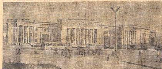
Таджикская ССР. Площадь имени В. И. Ленина в Душанбе.

14 октября 1924 года образовалась Таджикская АССР; с 1929 г.—союзная ССР.