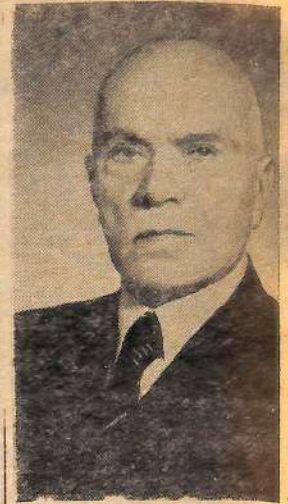
Шусев Алексей Викторович — выдающийся советский архитектор.