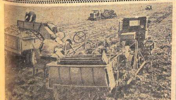
Днепропетровская область. Совхоз «Пушкинский» одним из первых в Добропольском производственном управлении приступил к механизированной уборке сахарной свеклы. Механизаторы выращивают ее по методу янтарного кубанского свекловода В. Светличного на площади 650 гектаров. В среднем с гектара получают более 250 центнеров корней.

На снимке: групповая уборка сахарной свеклы в совхозе «Пушкинский».