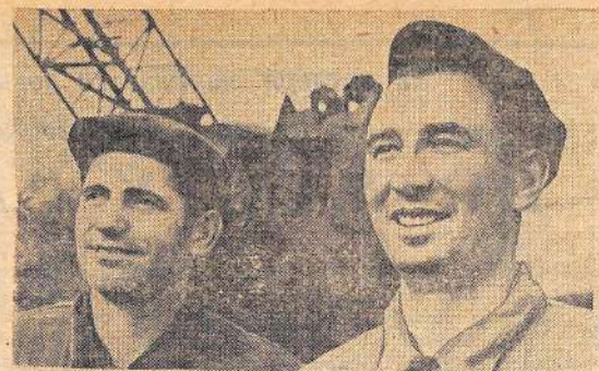
Кировоградская область. В социалистическом соревновании за максимальное использование ме-

Строители первого управления в счет 200 тысяч уже отработали 10.500, четвертого управления — 7.200, комбината промышленных предприятий — 3.830, управления дорожных и санитарно-технических работ — 1.600, школ города — 54.000, а всего по неполным данным — 81.130 часов.