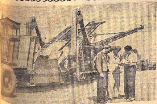
Машинная область, Калининский машиностроительный завод выпускает буртоукладчики — машины для разгрузки сахарной массы на автомашине. Здесь начато производство нового усовершенствованного буртоукладчика, который смонтирован на базе трактора Т-75 и укладывает бурты высотой до 6,5 метра и длиной 36 метров. К новому сезону сахароварения многие сахарные заводы страны получат эти машины.

подачу горячего и подают сигнал в случае отклонения температурного режима от установленных пределов. Сконструировали такую сушилку работники Всесоюзного научно-исследовательского института сельскохозяйственного машиностроения (ВИСХОМ) совместно с сотрудниками Главного конструкторского бюро по сушилкам Брянского совнархоза. Она успешно прошла государственные испытания.