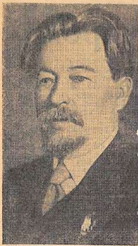
ШИШКОВ Вячеслав Яковлевич — писатель.

3 октября исполняется 90 лет со дня рождения.