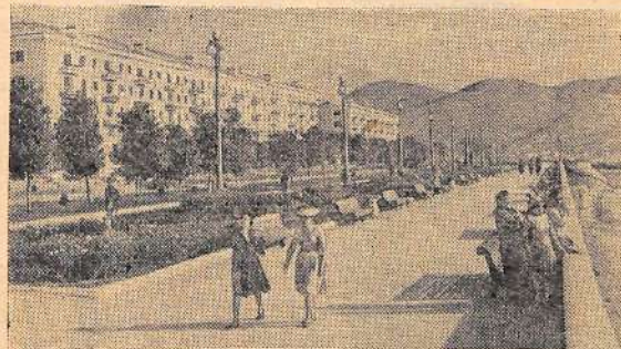
Новороссийск. Городская набережная. Фотохроника ТАСС.