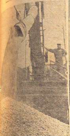
Доброготовительные пункты Саратовской области начали отправку зерна по Волге. Словно с Ровеского пункта отправлено водным путем более 30 тысяч тонн зерна нового урожая. На снимке: погрузка зерна в вагон теплого «Азов».