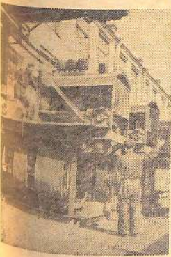
Ленинград. Механический завод тяжелого машиностроения выполняет заказы важнейшей стройки семилетия — магистрального газопровода Бухара — Урал. В этом году на строительство отпущены трубокладчики новейшего типа, автокраны и другое специальное оборудование. Закончено изготовление серии машин для очистки скважин. В ближайшее время они также будут отправлены на стройку.

♦ РОСТОВ-НА-ДОНУ На До- ней в разгаре уборки кукурузы. Органично ажно ведут эту работу трудящиеся (а вкз по по видственного управления. За 10 дней здесь собрали свыше 30 ты- сяч центнеров початков, из них 25 т. сч. уже отобраны на хлебопекарные пункты.