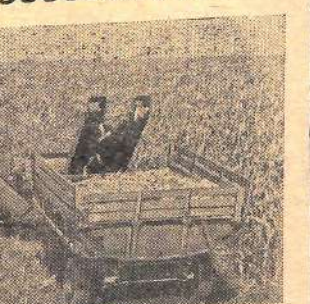
На полях Молдавии созрел богатый урожай кукурузы. В колхозах и совхозах началась уборка этой ценной культуры. На снимке: механизированная уборка кукурузы на зерно в колхозе «Победа» Фалештского производственного управления.

Имеются факты растаскивания и сжигания початков кукурузы с целью, а отдельные руководители колхозов, районных и сельских Советов, работники управления органами общественного порядка, прокуратуры мирятся с этим и не