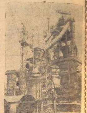
Символом Болгарии настоящего и Болгарии будущего называют сооружаемый в Кремиковцах металлургический комбинат. По окончании строительства он станет самым большим и современным предприятием в стране. Значительная часть оборудования и машин поставляет стройке Советский Союз. На снимке: первый доменная печь комбината.

Народная Республика Болгария как равноправный член братского социалистического содружества твердо и последовательно борется за мир и безопасность народов, за смягчение международной напряженности, за превращение Балкан в зону мира. Тесная сплоченность трудящихся вокруг Болгарской коммунистической партии, их верность идеям пролетарского интернационализма — залог грядущей победы коммунизма.