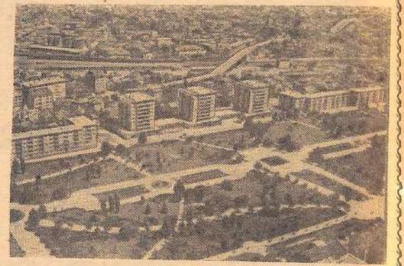
Народная Республика Болгария. София.