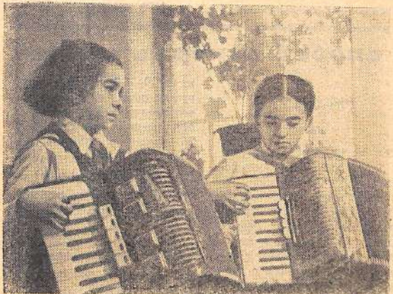
За годы народной власти в Болгарии построены тысячи школ. Для тех, кто любит музыку, открыты музыкальные школы. На снимке: занятия в детской музыкальной школе.