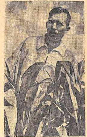
Красноярский край. Из года в год выращивает высокие урожаи кукурузы колхоз «За коммунизм» Минусинского производственного управления.

Поток хлеба государству возрастает с каждым днем.