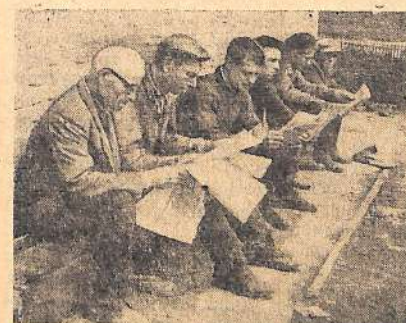
С большим интересом следят строители второй очереди кордного производства комбината искусственного волокна за событиями, происходящими в нашей стране и за рубежом. В обеденный перерыв они идут в киоск Союзпечати за свежими газетами, здесь же усаживаются и читают их.

секретарь парткома колхоза «Знамя коммунизма».