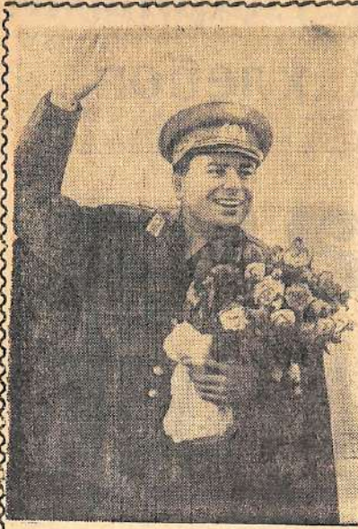
К годовщине (6-7 августа) со дня беспримерного в истории человечества космического полета советского корабля «Восток-2», пилотируемого летчиком-космонавтом майором Г. С. Титовым. Летчик-космонавт Г. С. Титов приветствует встречающих его на аэродроме 7 августа 1961 года. Фотохроника ТАСС.