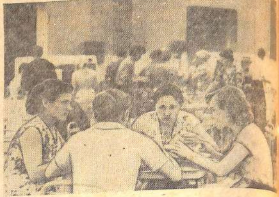
Хороший подарок получили жители поселка Сазанлей. Для них открылась новая столовая. В ней большой обеденный зал, самообслуживание. На снимке: обедают работники комбината бытового обслуживания.

Тревожные сигналы! Имн должен заинтересоваться партийно-государственный контроль, пресечь безобразия и наказать виновников.