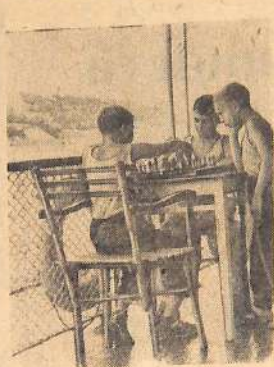
Юные шахматисты.