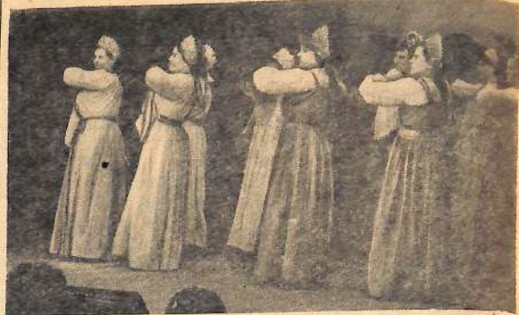
На смотре художественной самодеятельности работников просвещения коллектив школы № 41 занял первое место. А участницы литературно-музыкальной композиции «Я гражданин Советского Союза» удостоились права выступить на областном смотре.

Профессиональных Союзов. Из поступивших сведений видно, что реакционные силы страны использовали государственный переворот с целью наступления на демократические права эквадорских трудящихся, на прогрессивные партии и общественные организации страны.