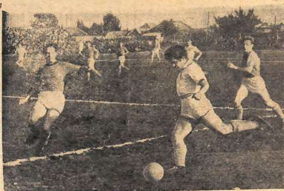
На городском стадионе. Момент игры футбольных команд балаковского «Химика» и саратовского «Динамо».