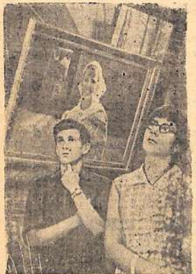
В начале июля в Балакове проходила выставка картин художников РСФСР. На снимке: в зале выставки.