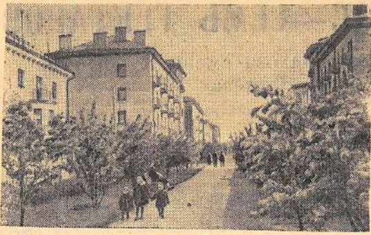
Смоленск — один из древнейших русских городов, разрушенный в годы Великой Отечественной войны, полностью восстановлен.

На снимке: новые жилые дома на Интернациональной улице.