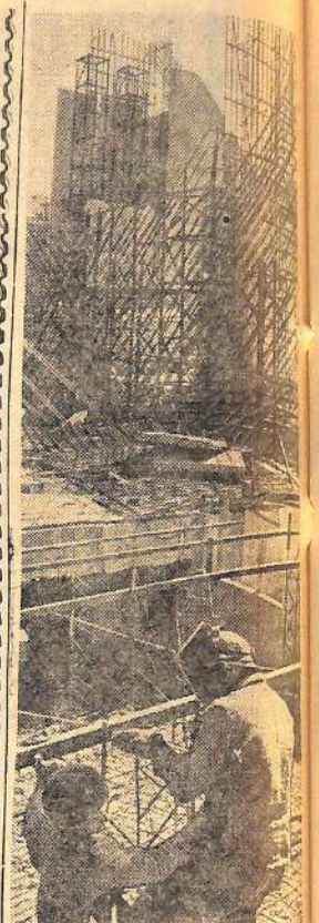
На берегу живописной Даугавы развернулось строительство одной из крупнейших в Прибалтике Плявиньской ГЭС. Она будет иметь мощность 825 тысяч киловатт и войдет в общенациональную энергосистему северо-запада страны.