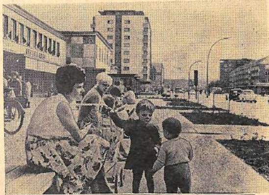
Полны света и воздуха широкие улицы молодого промышленного центра Германской Демократической Республики Энгенхюттенштадта. Хорошо живется здесь детям. Об их счастливым детстве позаботились родители — создатели и рабочие большого металлургического комбината «Ост», строители социалистического города.