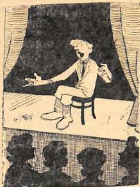
«Дайте в руки мне гармонь...»

до ее коллектив, возглавляемый Трушечко, не находит нужным зашпаклевать такими «пустяками». В домах до сих пор нет водопровода, не подведена канализация. И еще. Около многих домов строители оставляют после себя огромные кучи мусора. Вот, например, как выглядит территория дома 65 «А» по улице Балаковской. Перед фасадом здания разсыпано примерно около тонны битого стекла. С боковых сторон первый этаж дома надежно защищен от всех ветров сооружениями из остатков камышитовых плит, застывшей массы бетона, известки, обломков досок и другого мусора, происхождение которого трудно определить. Месяц назад на территории двора усердно работал бульдозер. Названные сооружения — результаты его труда. Мусор нагромодили в о нем забыли.