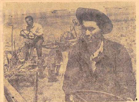
Астраханская область. Механизаторы Зеленинской машинно-животноводческой станции ведут косовицу и заготовку естественных кормов на Черных землях.

Областное объединение «Сельхозтехника» обязано ускорить заов в колхозы и совхозы минеральных удобрений для подкормки посевов кукурузы, а также переоборудование пропашных культиваторов и изготовление дополнительных рабочих органов культиваторов для глубокого рыхления междурядий.