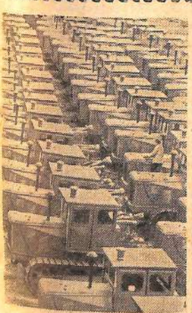
В июне исполняется 30 лет со дня пуска Челябинского тракторного завода.

В настоящее время с конвейера ЧТЗ соходят 100-сильные тракторы нескольких модификаций.