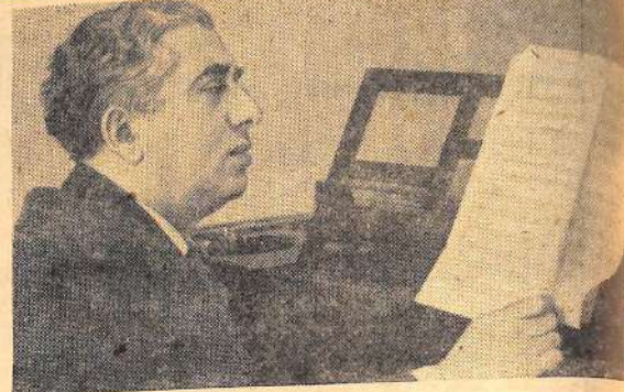
Хачатурян А. И. — композитору, народному артисту СССР, лауреату Ленинской премии, исполнилось 60 лет со дня рождения

Кроме того, установлено 11 денежных премий для организаций потребительской кооперации, добившихся лучших показателей в перевыполнении планов и заданий по заготовке и