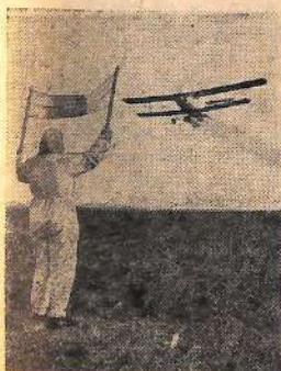
Куйбышевская область. Трудно найти сейчас хозяйство, где бы ни побывали представители «пятого океана». В колхозе «Путь Ленина» Ставропольского производственного управления авиаторам предстоит произвести подкормку 1200 гектаров. Самолеты Приволжского территориального управления ГВФ в нынешнем году проведут авиационно-химические работы в колхозах и совхозах области на площади свыше 300 тысяч гектаров — в полтора раза больше, чем в прошлом году.