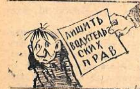
Ехал влево. Ехал вправо. И на год лишился прав.

автомобилей было отмечено в нефтеперерабатывающей станции, на участках «Монтажмизац и т», «Промветилиция», в учебно-производственных предприятиях общества слесней, городском коммунальном хозяйстве и других. Особенно плохо обстоит дело в этом отношении в городском автохозяйстве. Из 266 автомобилей на день осмотра технически исправных было только 199. Здесь очень слабая дисциплина среди водителей. Они систематически допускают нарушения правил уличного движения и совершают аварии.