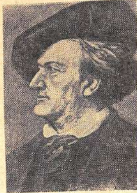
открывается высокое гуманистическое искусство, способное доставить истинную художественную радость.

«Он был одарен великим даром поэзии, могучего творчества», — писал русский критик В. В. Стасов. В лучших произведениях Вагнера слушатель