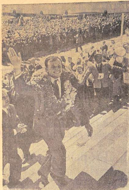
ЧЕТВЕРТАЯ ВСЕСОЮЗНАЯ ХУДОЖЕСТВЕННАЯ ФОТОВЫСТАВКА «СЕМИЛЕТКА В ДЕЙСТВИИ», 1963 год. «ГОСТЬ ФЕСТИВАЛЯ» (Хельсинки).

Величественно раскинулась на волжских берегах панорама Всесоюзной ударной комсомольской стройки—Балаковского комбината искусственного волокна. Новые корпуса цехов растут на глазах, а на первой действующей очереди один за другим поступают на склад готовой продукции рулоны высокопрочного корда.