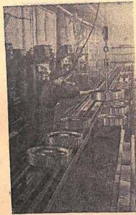
Ленинград. Завод имени Котлякова технически перевооружается. К концу семилетки он станет одним из ведущих специализированных предприятий, изготавливающих крупные редукторы. Выпуск продукции в этом году по сравнению с 1960 годом увеличится почти в два раза, а в 1965 году утроится. На заводе введены в строй пять высокопроизводительных поточных линий: три для обработки корпусов и две — для зубчатых колес. На снимке: механизированная поточная линия обработки зубчатых колес. Один рабочий обслуживает 8 зуборезных станков.