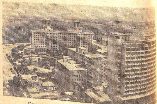
Столица Республики Куба — Гавана.

В длительной и упорной двухлетней борьбе повстанческой армия, возглавляемая Фиделем Кастро, нанесла, сторонникам диктаторского режима сокрушительное поражение. Сорочатся армия, вооруженная и поддерживаемая империалистами США, не смогла противостоять революционному энтузиазму народных масс, возглавляемых Кастро. В ночь под новый 1959 год Батиста и его клика бежали в США. Власть перешла к народу. Фидель Кастро в феврале 1959 года стал премьером первого подлинно революционного правительства Кубы.