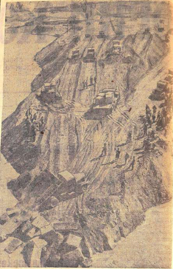
«Покорение Вахша». Четвертая Всесоюзная художествен- ная фотовыставка «Семилетка в действии», 1963 год.