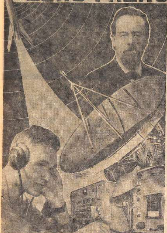
Плакат художника Ю. Берковского.