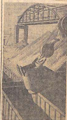
Кемеровская область. Таштагол — молодой горняцкий город, ему всего несколько месяцев. Здесь расположены шахты, которые снабжают рудой почти всю металлургию Кузбасса.

На снимке: погрузка таштагольской руды.