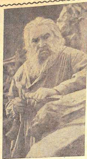
Довженко, картиной «Космос».

Москва. Во всем мире известно имя советского скульптора С. Т. Коненкова. Когда входил в его мастерскую, то попадаешь в волшебное царство искусства. Вас окружают созданные им из дерева образы из русских народных сказок. И даже тогда, когда художник обращается в своем творчестве к этой теме, он умеет найти что-то новое, свое, чего нет у других художников. Созданная автором галерея портретов подкупает любовью к людям, правдивостью, эмоциональным воздействием на зрителя. Поражают своей законченностью и выразительностью скульптуры «Самсон», «Паганини», «Авостпортрет». За последний художник был удостоен Ленинской премии.